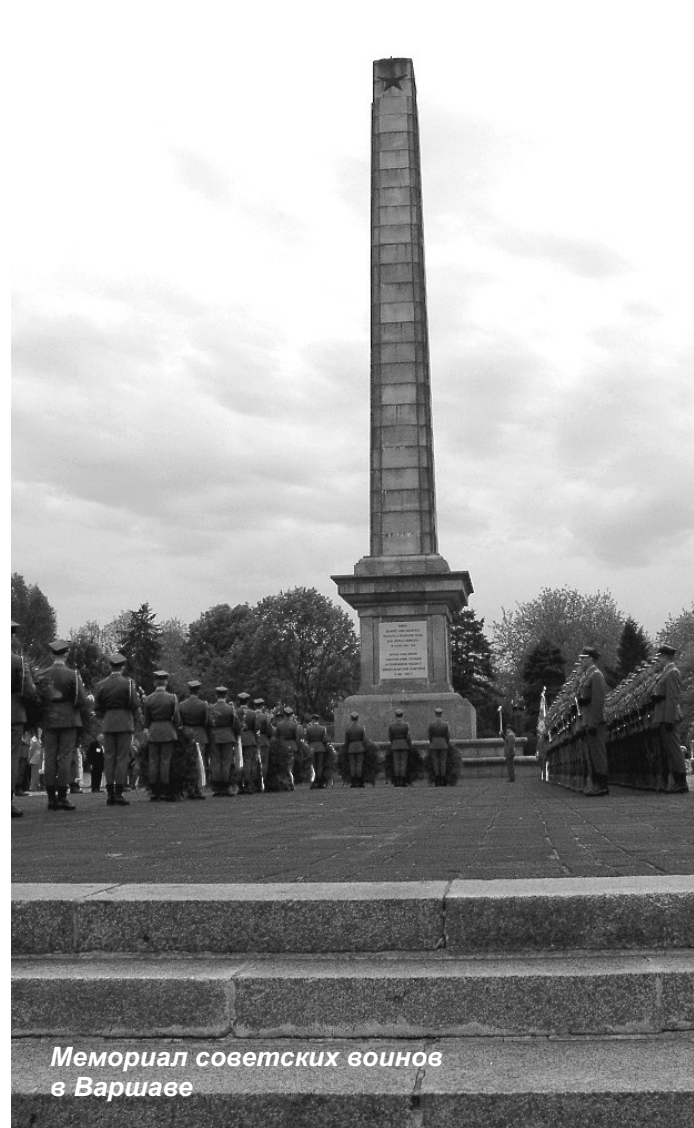
Мемориал советских воинов в Варшаве